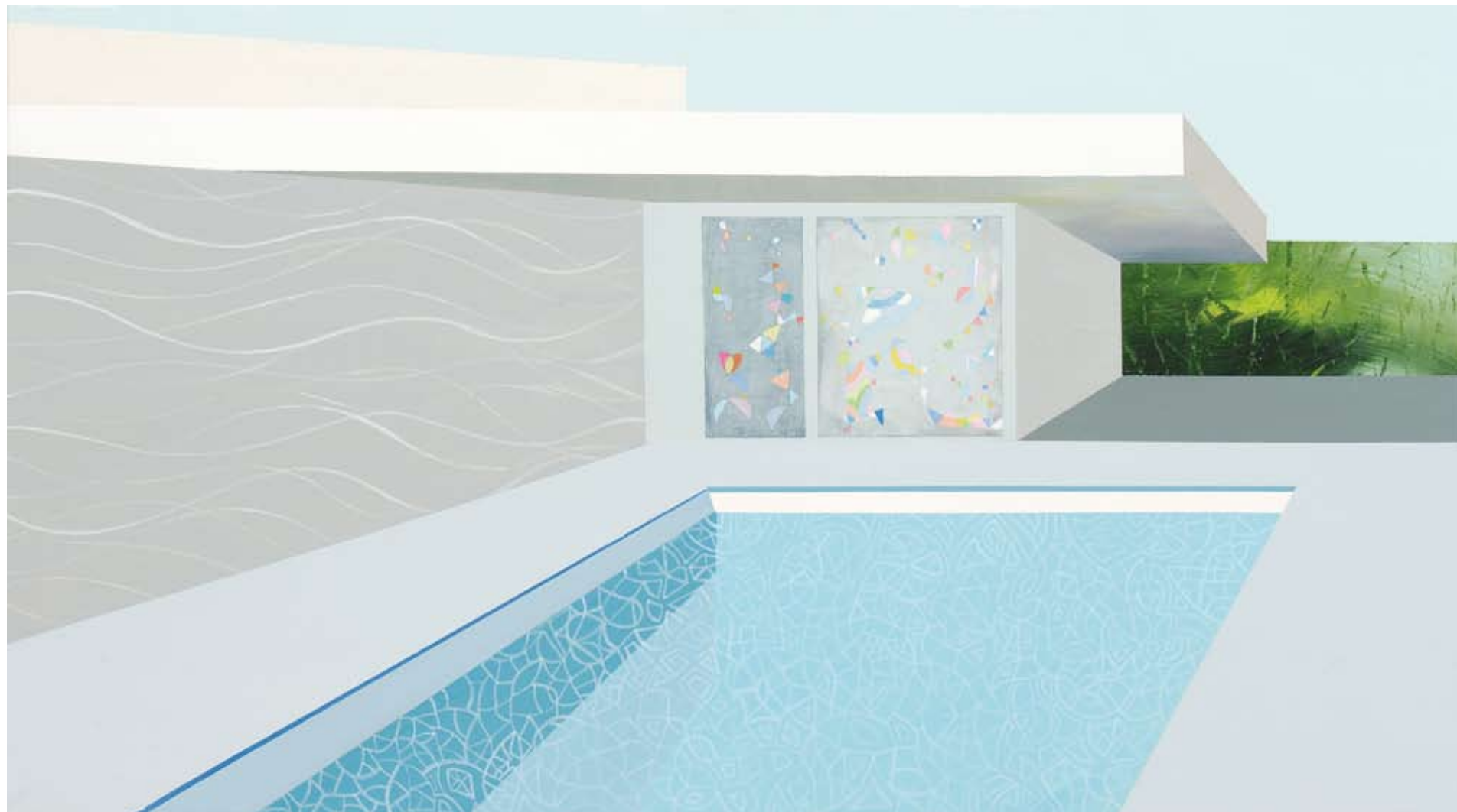
ακρυλικό σε καμβά | 55X100 εκ.