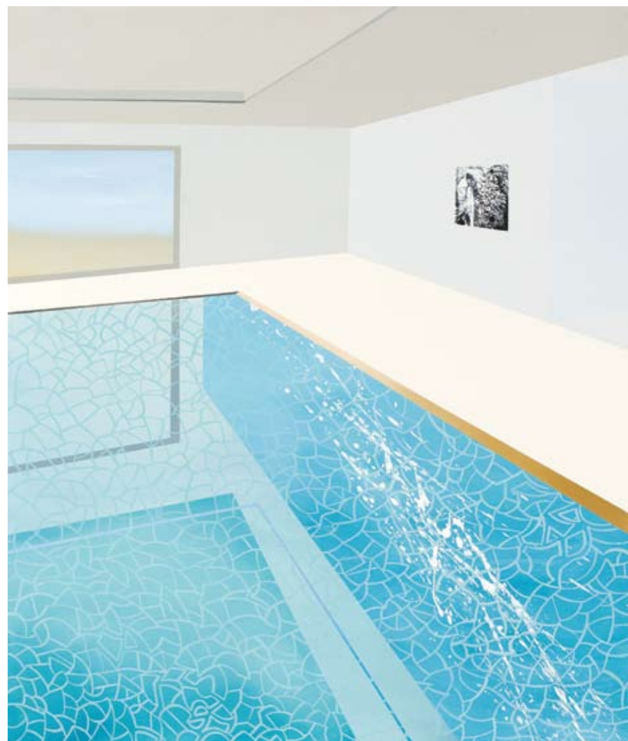
ακρυλικό σε καμβά | 100X85 εκ.