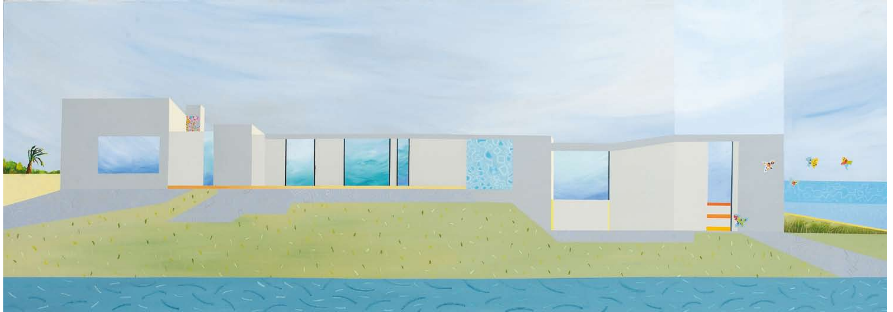
ακρυλικό σε καμβά | 70X200 εκ.