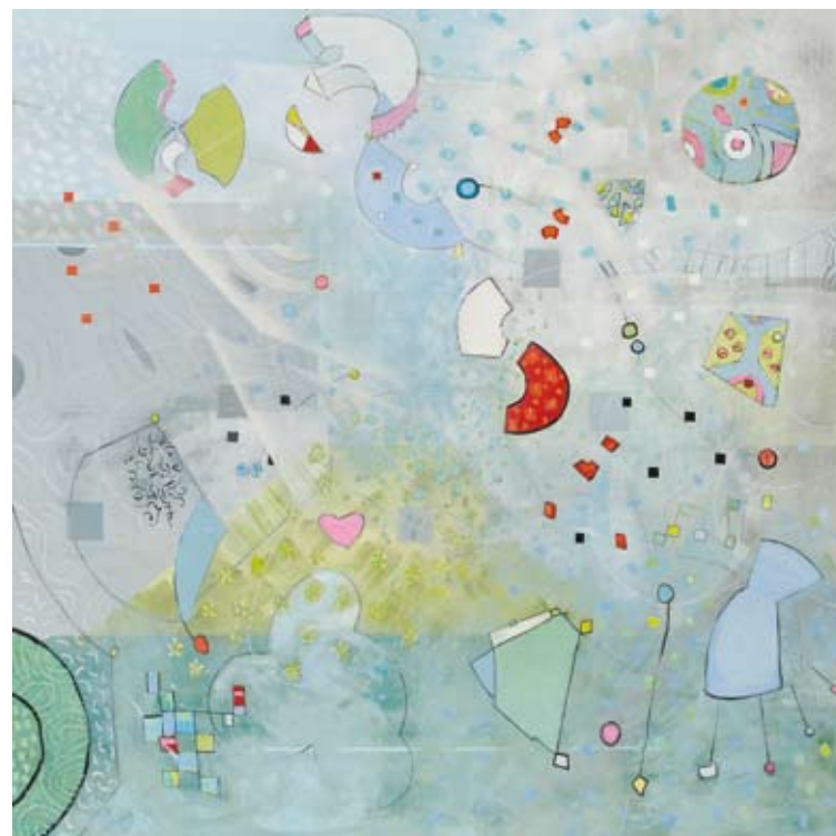
ακρυλικό σε καμβά | 130X130 εκ.