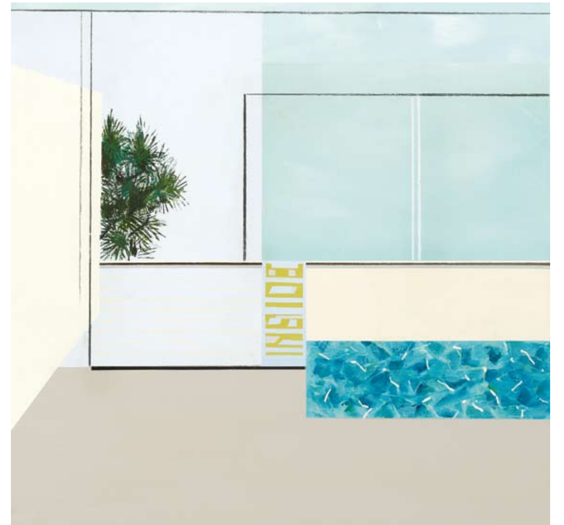
ακρυλικό σε καμβά | 80X90 εκ.