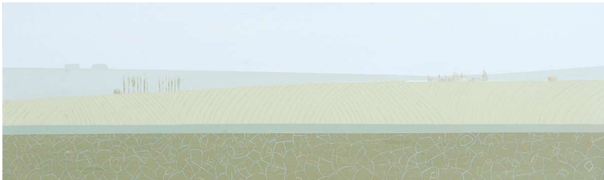
ακρυλικό σε καμβά | 50X160 εκ.